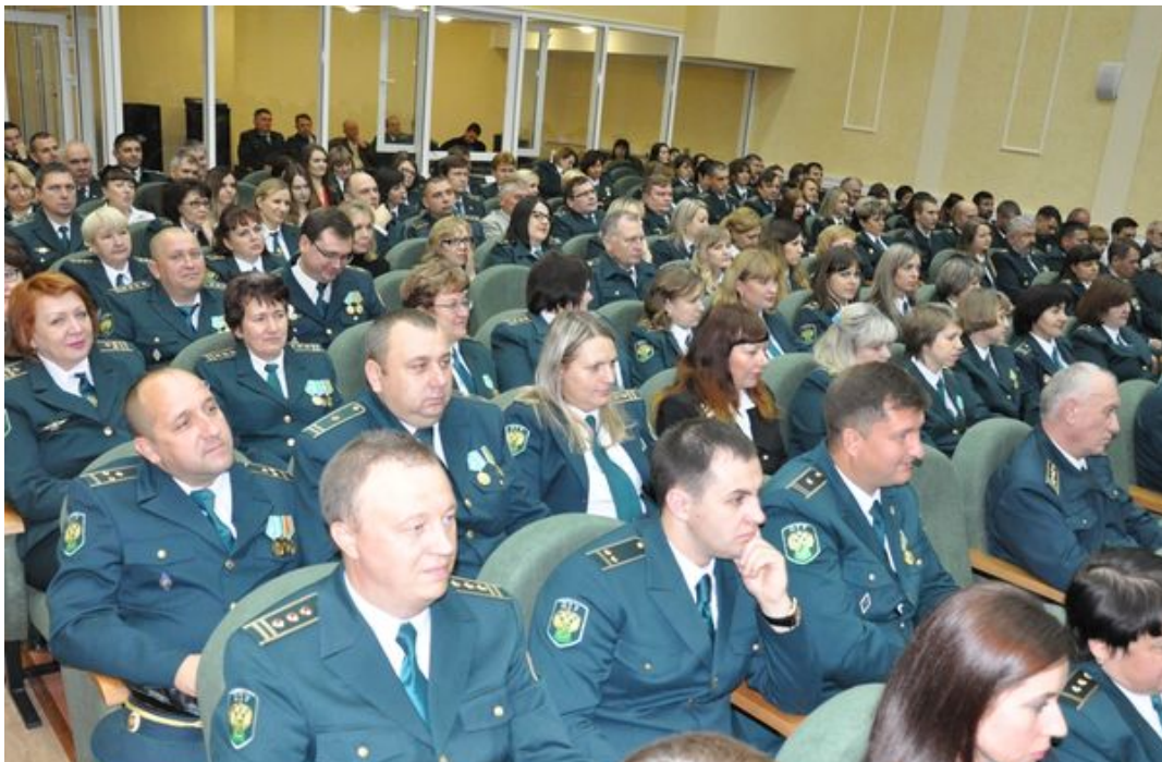
Федеральное таможенное управление в Белгородской области проводит Федеральное